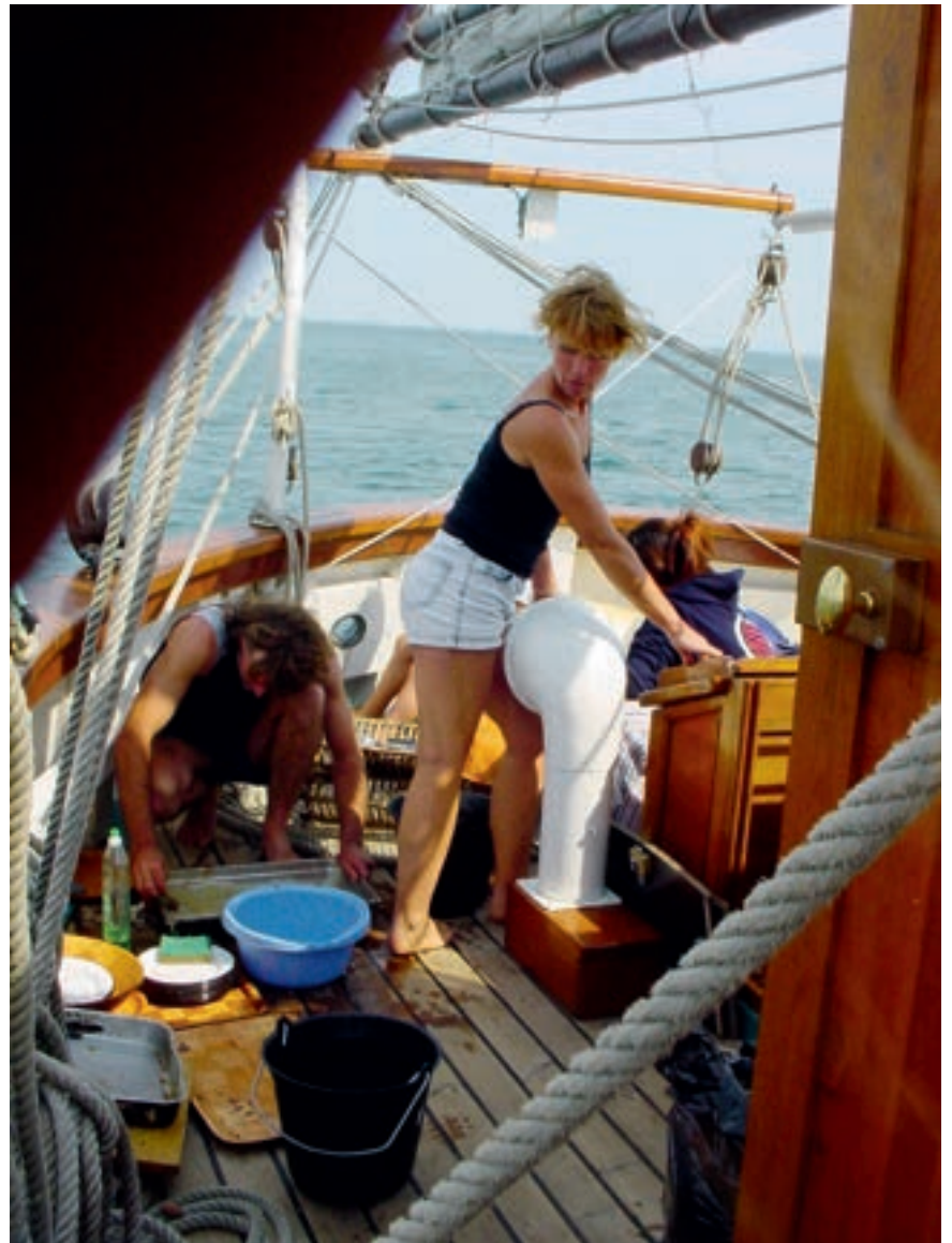
Vaisselle à bord. Les stagiaires ne participent pas qu'aux manœuvres, mais aussi à la vie à bord (cuisine, vaisselle, entretien des équipements, etc.).