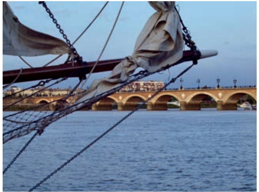
Depuis les années 1980, l'Arawak est basé à Bordeaux puis dans la commune voisine de Lormont.