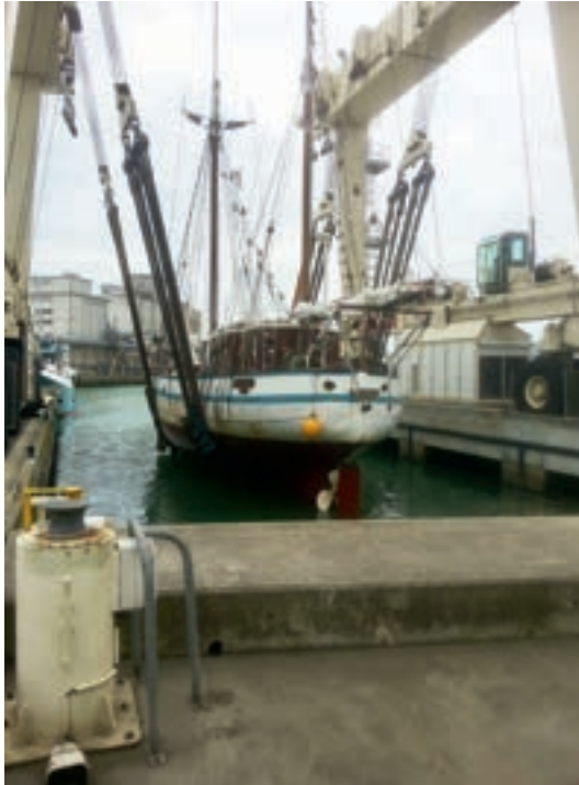
Sortie carénage aux Sables-d'Olonne, en 2019. L'entretien de l' Arawak coûte environ 40 000 € par an.

conserver le poisson au frais. Il prend la mer en 1954, pêche en mer d'Irlande l'hiver et dans le golfe de Gascogne, jusqu'aux côtes africaines, à partir du mois de mars.