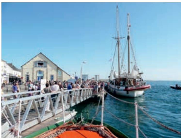
Le retour du bateau à Étel, son premier port d'attache, en 2011, a été un événement pour les habitants.