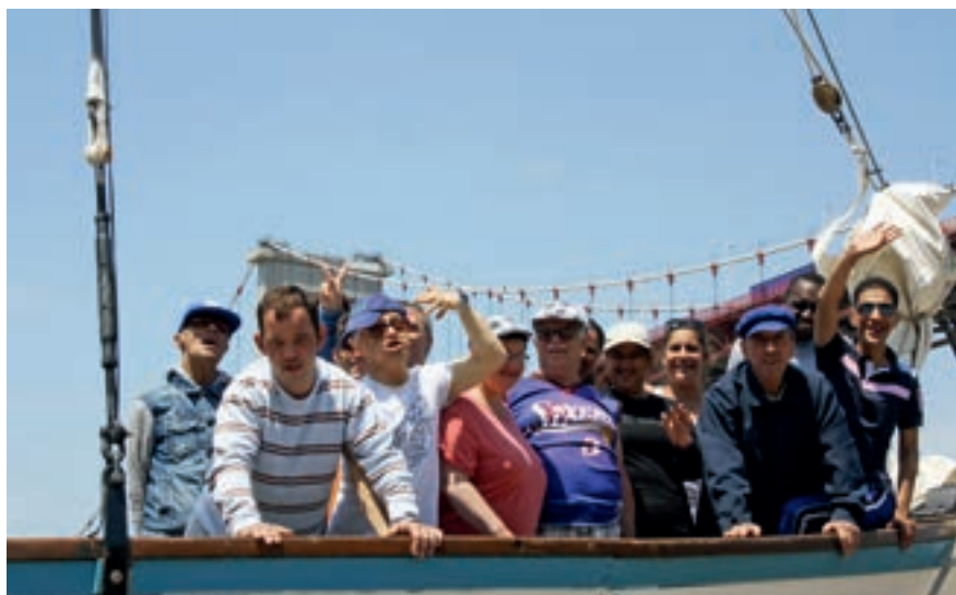
L'association de l'Arawak propose des stages de voile adaptés à des groupes de personnes atteintes de handicaps ou en difficulté sociale. Ici, l'un des groupes lors d'un séjour, à Lormont, en 2017.