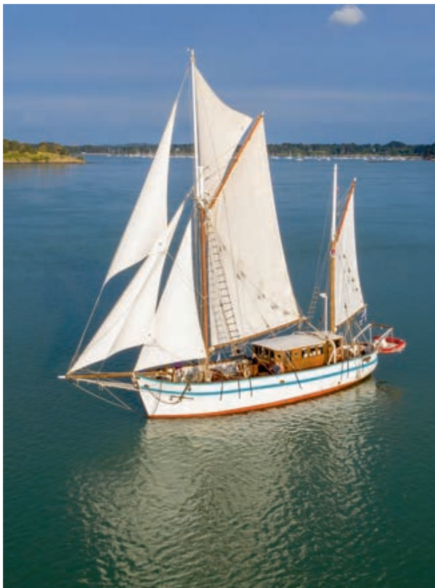
Construit au chantier naval Union et Travail des Sables-d'Olonne en 1953, le Refuge des marins (premier nom de l' Arawak ) a longtemps pêché le thon entre la mer d'Irlande et les côtes africaines.

Le bateau et son passé attisent aussi la curiosité de ses stagiaires. Au début de l'aventure, son histoire est encore méconnue. On sait tout au plus que le chalutier thonier, attaché au port d'Étel, a d'abord pêché dans le Morbihan. L' Arawak a été construit aux Sables-d'Olonne, en Vendée. Entre 2008 et 2010, l'association y retrouve des archives du chantier naval Union et Travail et même quatre des charpentiers de marine qui ont bâti le Refuge des marins - de son nom de baptême - au cours de l'hiver 1953. En bois, il est équipé d'un gréement traditionnel, mais aussi d'un moteur. Comme tous les bateaux de pêche après la Seconde Guerre mondiale, il possède des glacières pour