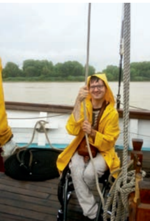
Sur l'Arawak, tout le monde participe aux manœuvres, une bonne façon de reprendre confiance en soi. Ici, une personne en fauteuil hisse le foc (voile d'avant).